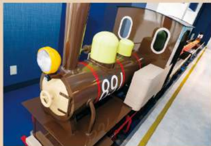
全周約200メートル、2階のフロアをぐるりと回る「ハグハグトレイン」(1回1名300円)。トンネルや鉄橋、踏切など鉄道会社ならではの演出があり、乗車中の子供を撮影できるフォトスポットもあり。

れ、暑さや寒さが厳しい日でも、乳幼児が安心して体を動かせる場となっているのもうれしいポイント。そのほか、カフェやキッズトイレ、フロアを二周するミニSなど、どこにいても子供が楽しめる工夫が散りばめられ、鉄道会社ならではのこだわりも光っています。駅からのアクセスもよく、駐車場も広く、リピートしたくなる遊び場です。