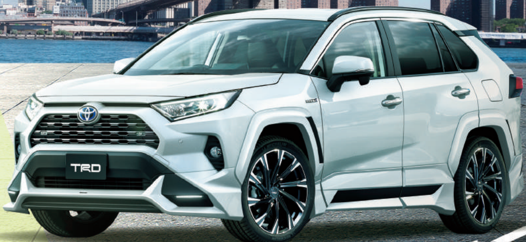
Photo:HYBRID G。ボディカラーのホワイトパールクリスタルシャイン(070) [32,400円]はメーカーオプション。価格には含まれておりません。販売店装着オプションのBCDEFGを装着しています。 ※写真は灯火類を点灯させた状態です。写真の色や照度は実際とは異なります。