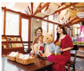
BEATRIX POTTER™ © Frederick Warne & Co.,2019