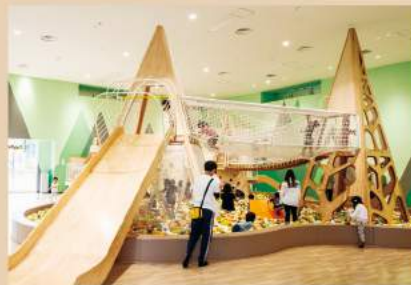
体育スペースにある「もりのあそびば」には、巨大ボールプールや滑り台、ボルダリングウォールなど多摩産の木で作られている大型複合遊具が、ダイナミックに体を動かして遊べるスペースです。