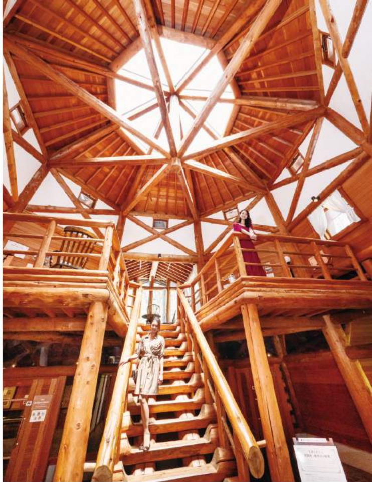
複雑な木組みが魅力の展示館では 絵本の歴史と文化が学べる貴重な史料を展示