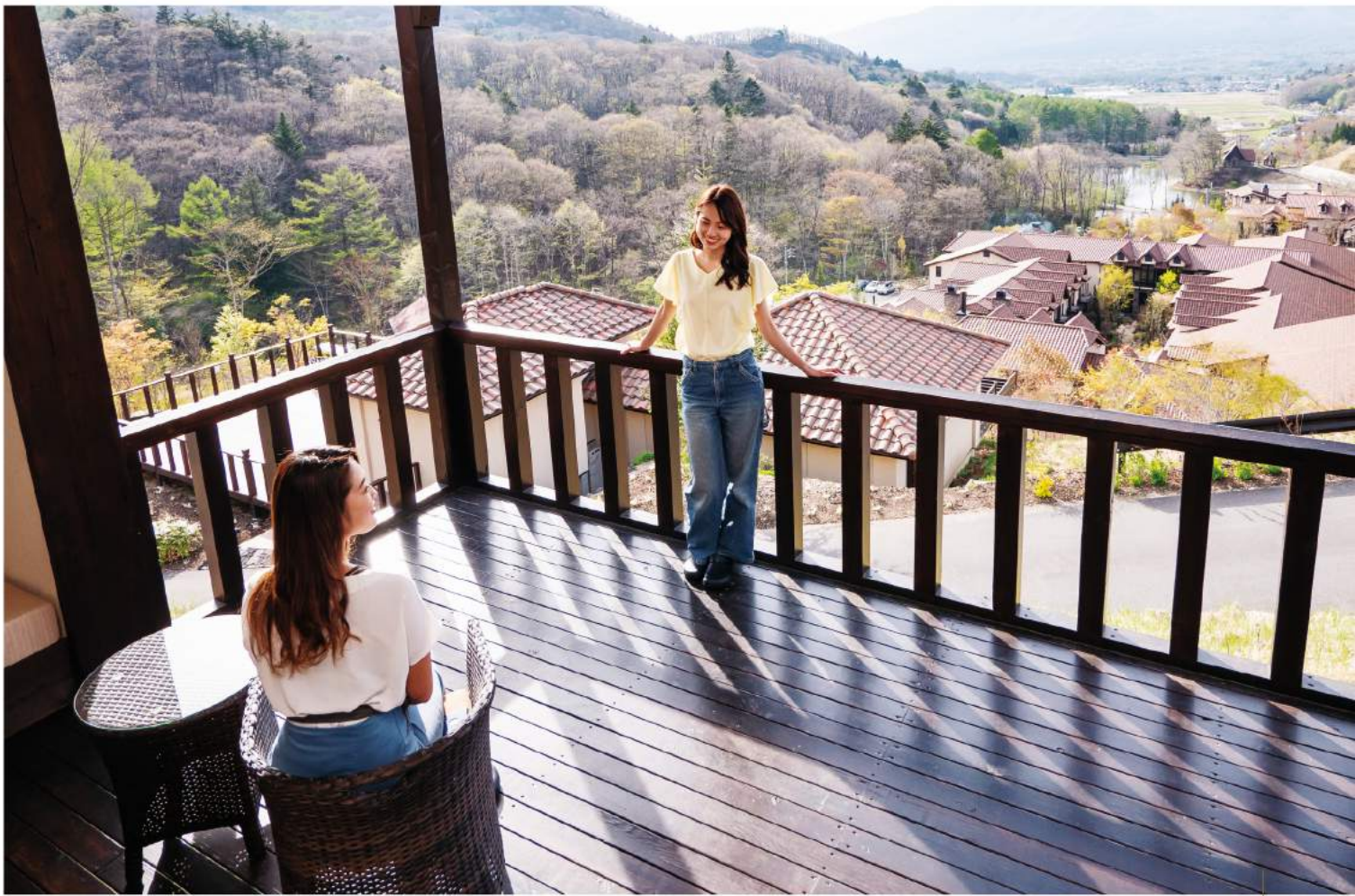
雄大な浅間山と南軽井沢の自然を一体で楽しめる特別な空間