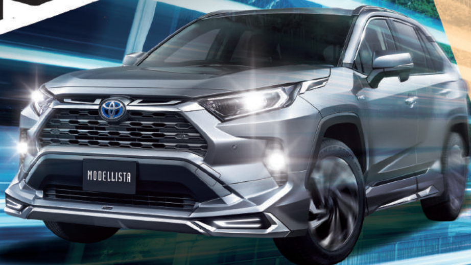
Photo:HYBRID G。ボディカラーはグレーメタリック(1G3)。販売店装着オプションのBCDを装着しています。 ※写真は灯火類を点灯させた状態です。写真の色や照度は実際とは異なります。