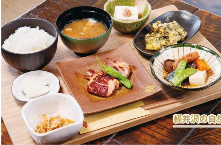
軽井沢の自然とおいしい食事が楽しめる