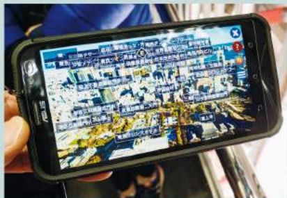
ツアーは事前予約&時間指定をすど待たずにトップデッキに上がれます。参加者にはスマートフォンによる音声ガイド(13言語対応)の貸し出しサービスがあります。

エレベーターはガラス窓のサイズが従来のものより大きくなり、見晴らしのよさが印象的です。エレベーターを降りると、そこに広がるのは東京の風景が映し出された不思議な空間。ジオメトリックミラーとLED照明の演出によって、未来都市へ訪れたような雰囲気です。250メートルの高さで体験する浮遊感と東京の未来。ぜひ一度試してみてください。