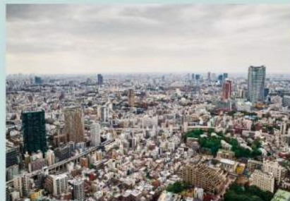
高さ250メートルのトップデッキから眺める東京の景色は、東京タワーならではのもの。昼夜でそれぞれ別の顔を見せる東京の街の風景が楽しめます。写真は六本木方面です。