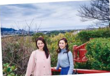
太平洋や伊豆諸島を一望 景色のよさも自慢です！