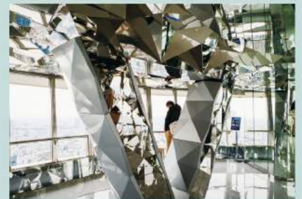
開業以来2回目の大型リニューアルとなったトップデッキ。天井や柱の変則的な三角形の鏡に風景と人が混在して映り込み、不思議な世界を作り出しています。

新アトラクション「トップデッキツアー」はお得感も満載！例えば、プラットフォームではドリンクや写真撮影のサービスが。撮った写真はステキなカードにしてプレゼントしてくれます。