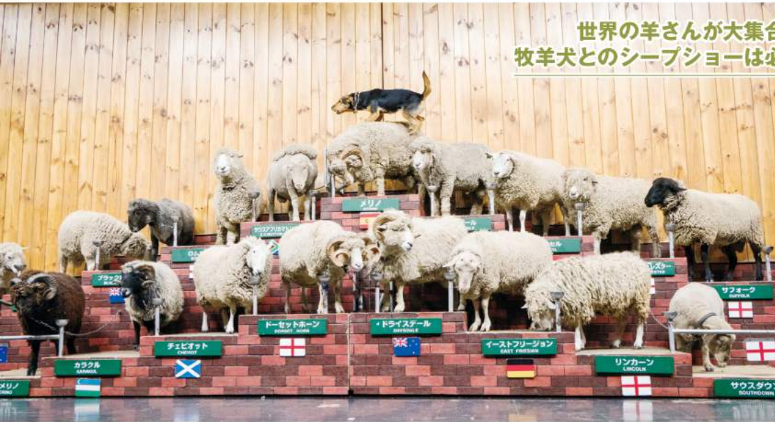
世界の羊さんが大集合！ 牧羊犬とのシープショーは必見

富津市の鹿野山山頂にあるマザー牧場は、「花と動物たちのエンターテイメントファーム」をテーマにした観光牧場。250ヘクタールという広大な敷地を備え、自然にあふれた環境が自慢です。場内には、四季を感じさせる色とりどりの花が植えられ、季節ごとのイベントも多数用意されています。また、東京湾まで見渡せる観覧車からの景色は必見です。