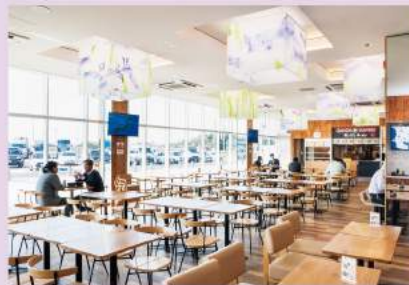
「SHOBU花見CHAYA」は、隈研吾建築都市設計事務所が内装デザインを監修。菖蒲をモチーフとした美しい色彩のペンダントライトや、木材を多用した温かみのある空間が特徴です。