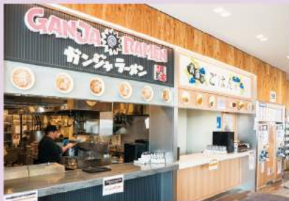
7都県と隣接する埼玉県の中でも、県北は5つの県と接する交通の要所。地元の人気メニューに加えて、「7つ街道」にちなんだ沿線地域のメニューが期間ごとに提供されています。