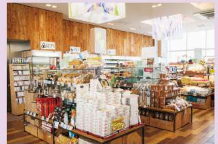
菖蒲PA「SHOBU花見CHAYA」内のお土産売り場。広い店内には埼玉県の有名品やオリジナル商品を扱う地産コーナーもあり、ここだけでも目移りするほど充実しています。

菖蒲PAには圏央道唯一のガスステーション（出光興産）が併設されています。スタッフによる給油サービスで24時間営業。とても広いので、大型トラックもらくらく入れます。