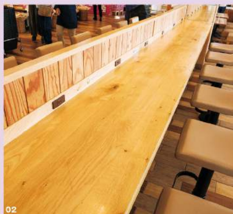
01 電気自動車・プラグインハイブリッド車用のクイックチャージ設備。地面に青と白で大きく描かれた「EV QUICK」マークや看板が目印です。02 フードコートとショッピングコーナーの間には、コンセントが使えるカウンターテーブルも。食事を取りながらパソコンで仕事をしたり、カメラの充電などができます。