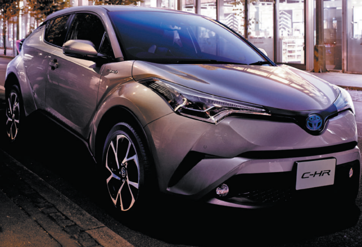
Photo (上) : C-HR G (1.8L・2WD・5人乗り)。ボディカラーはメタルストリームメタリック (1K0)。Bi-Beam LEDヘッドランプ+LEDクリアランスランプ+LEDシーケンシャルターンランプ+LEDテイルライト+LEDリヤコンビネーションランプはセット [151,200円] でメーカーオプション。リヤグロストラフィックアラートとバックカメラはセット [37,800円] でメーカーオプション。■写真は合成です。 Photo (右) : G (1.8L・2WD・5人乗り)。ボディカラーはメタルストリームメタリック (1K0)。