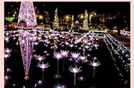
スイレンとバラを中心としたさまざまな光の花が咲き乱れる「光のフラワーステージ」。その中には高さ13mのシンボルトワーが輝いています。