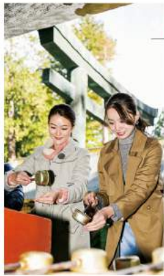
豊かな森に抱かれた 歴史ある神社を参拝