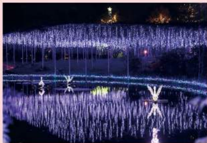
水面に浮かび、今にも飛び立ちそうな「白鳥の湖」。本物の「奇跡の大藤」上にライトアップされたブルーの世界に包まれ、なんとも幻想的な空間です。