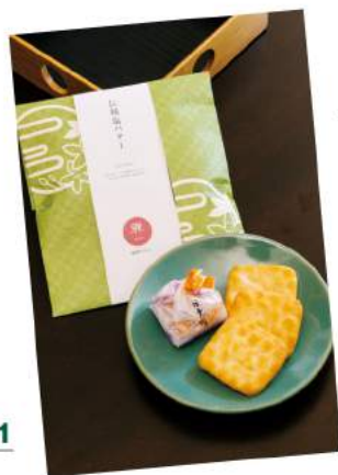
オリジナルのお菓子や 県内の銘菓を召し上げれ

界 鬼怒川のお部屋は、全3タイプ。レインシャワー付きのベーシックなお部屋と、温泉露天風呂があるお部屋が2種類。露天風呂つきのお部屋の内、1室だけが芝生のドッグランがついたベット対応のお部屋です。今回、宿泊したのは露天風呂付きのお部屋。テラスの露天風呂から星空を眺める一時は至福の時間です。