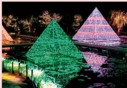
緑、オレンジ、ピンクなど水辺に映り込んだ形が美しい5基の「光のピラミッド」。それぞれ大地、太陽、自然、空、平和をイメージしています。