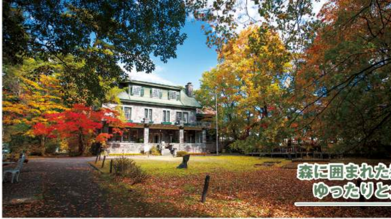
森に囲まれた洋館で ゆったりと食事を

日光東照宮のすぐ東に位置する森に囲まれた洋館。それが人気のレストラン「明治の館」です。その名の通り、明治の息吹を感じられる石造りの洋館を使ったお店で、気品あふれる空間で、熟練シェフの手による洋食をいただける評判です。単品料理はもちろん、コース料理も用意されているので、ぜひチェックしてみてください。