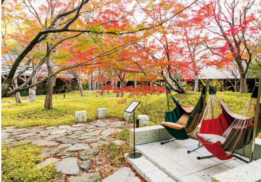
眺めているだけで癒やされる 四季折々の表情を見せる中庭