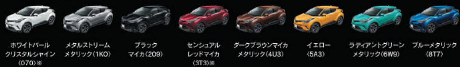
ホワイトパールクリスタルシャイン (070)※ メタルストリームメタリック (1K0) ブラックマイカ (209) センシュアルレッドマイカメタリック (3T3)※ ダークブラウンマイカメタリック (4U3) イエロー (5A3) ラディアントグリーンメタリック (6W9) ブルーメタリック (8T7)