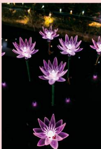
01 昨年よりボリュームアップして登場した「光のバラ園」。パノラマに広がるバラは輝かしく、妖精と共にいるよう。40万球のライトが使用されています。02 バラは光色に変化します。03 細部までこだわって再現させた光のスイレン2000輪が咲き誇ります。