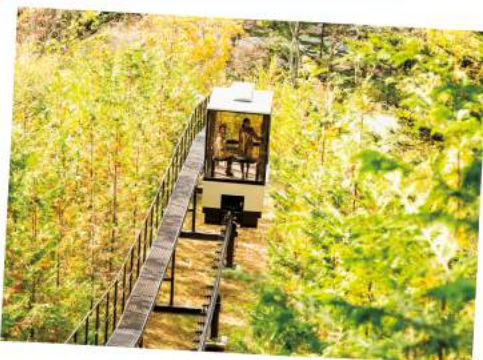
駐車場から宿へは スロープカーで アクセス