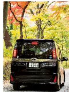
精悍なブラックは、鬼怒川の紅葉に映え、さらに美しく見えました。

今回のお供は、精悍なルックスで人気を集めるヴォクシーの特別仕様車「煌II」。魅力ある広い室内空間は、上着などで持ち物がかさばる、これからの旅行シーズンにもばっちり対応します。絶妙なシートの高さで、日光のような込み入ったエリアでも快適に運転できるのもポイントです。なによりドライブ中の眺めのよさは、ミニバンならではの！