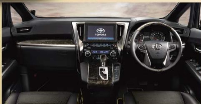
Photo:ヴェルファイア 特別仕様車 Z'A EDITION-GOLDEN EYES* (7人乗り・2WD) [ベース車両はZ(7人乗り・2WD)]。内装色はブラックボディカラーのパーニングブラッククリスタルシャインガラスフレック(222) [32,400円]、インテリジェントリアアシストモニター、T-Connect SDナビゲーションシステム+インテリジェントパーキングアシスト2はセット [561,600円] でメーカーオプション。専用フロアマット(エンタランスマツ無) [98,280円] は販売店装着オプション。価格には含まれておりません。