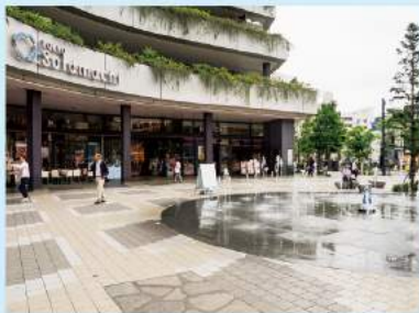
東京スカイツリータウン内には、季節の木々を目にすることができる広場やガーデンもあります。色々見て回るのが疲れたら、ほっと一息つくことができます。

2012年のオープンから4周年を迎え、すっかり日本のシンボルとして定着した東京スカイツリータウン。地上350メートルの展望デッキと、さらに上の450メートルの展望回廊を備える東京スカイツリー®はもちろん、日本の新旧名物を取りそろえた東京ソラマチ®、さらにプラネタリウムや水族館まで完備した東京スカイツリータウンは、まさに誰もが楽しめる一大アミューズメントパーク。 遙か上空からの景色も素晴らしいですが、634メートルの高さを誇る東京スカイツリーを下から見上げるのも大迫力の光景です。日本の良いものが集まった東京ソラマチを見て回れば、あつという間に1日を過ごせてしまいますよ。