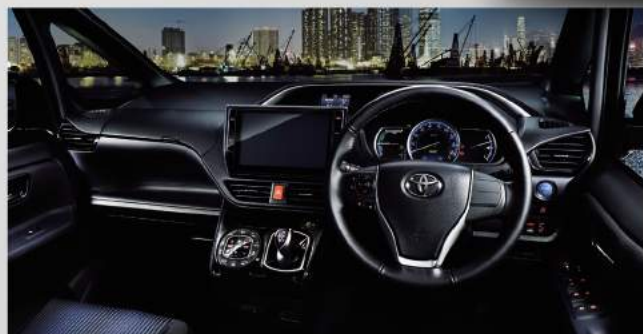
Photo:ヴォクシー 特別仕様車 HYBRID ZS “煌(きらめき)Ⅱ” [ベース車両はHYBRID ZS]。ボディカラーはブラック(202)。内装色はダークブルー&ブラック。ナビゲーションシステムはT-Connectナビ10インチモデル [306,720円] は販売店装着オプション。価格には含まれておりません。