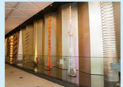
4階の入口フロアには、東京スカイツリーの建築美を竹細工や和子といった伝統工芸で表現する「スーパークラフトツリー」が並んでいます。