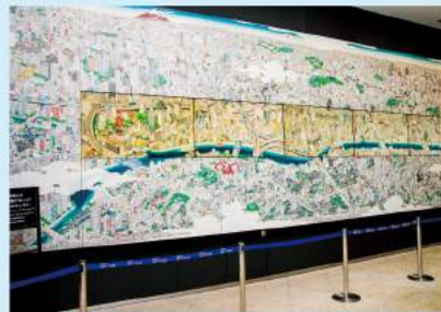
1階の団体ロビーフロアにある「隅田川デジタル絵巻」は、江戸の営みや風物を13枚の映像モニターを使って、よりいさいさと描き出しています。