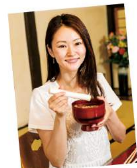
大内宿名物のネギ蕎麦も いただけます！