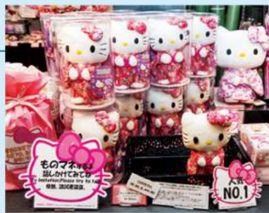
©1976, 2016 SANRIO CO., LTD. APPROVAL NO.S571546

スヌーピーやハローキティなどの人気キャラが、和のアイテムとコラボレーション。振袖姿のキティちゃんぬいぐるみのほか、風呂敷や手ぬぐいなど日常から使える雑貨もありますよ。